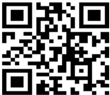
113-1生涯發展教育融入 領域課程活動教師檢核表

若老師有配合生涯發展教育 融入課程相關的學習單， 請提供給資料組， 繳交者~~~ 將可獲得神秘小禮物！！！！