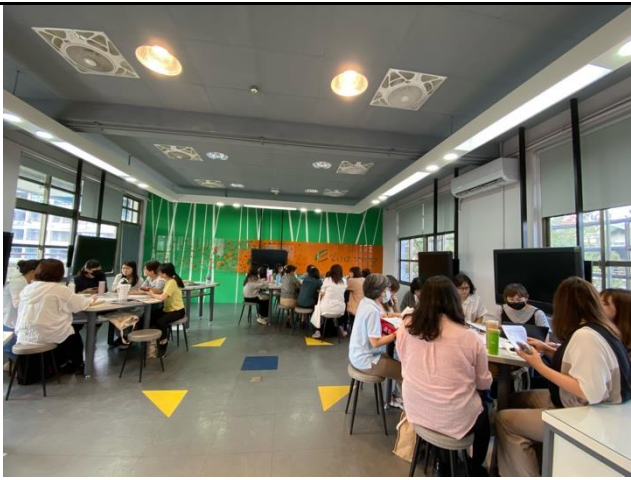
各年級分組討論 簽到表