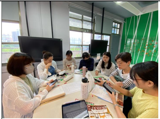
七年級討論來年課程計畫 簽到表