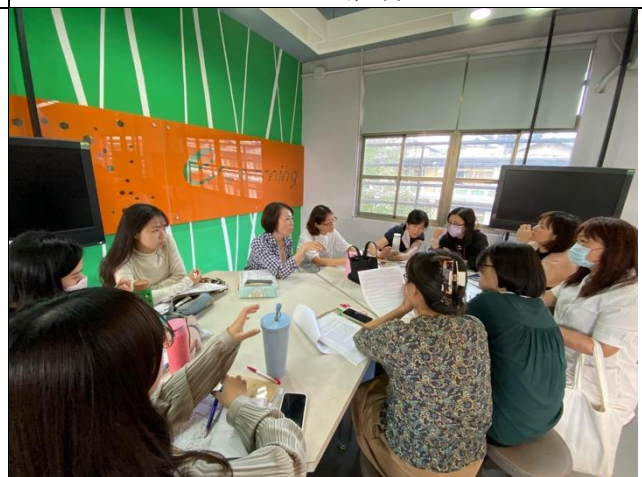
八年級檢討第二次段考試題