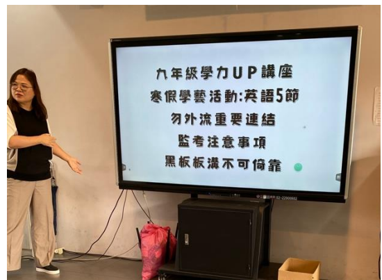
總召報告會議內容