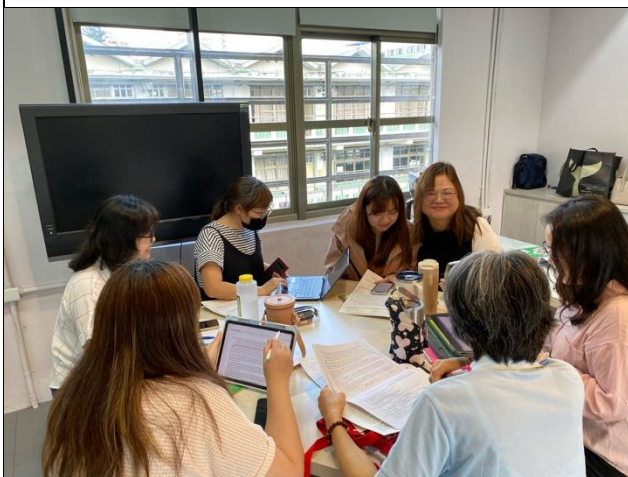
九年級檢討第二次段考試題